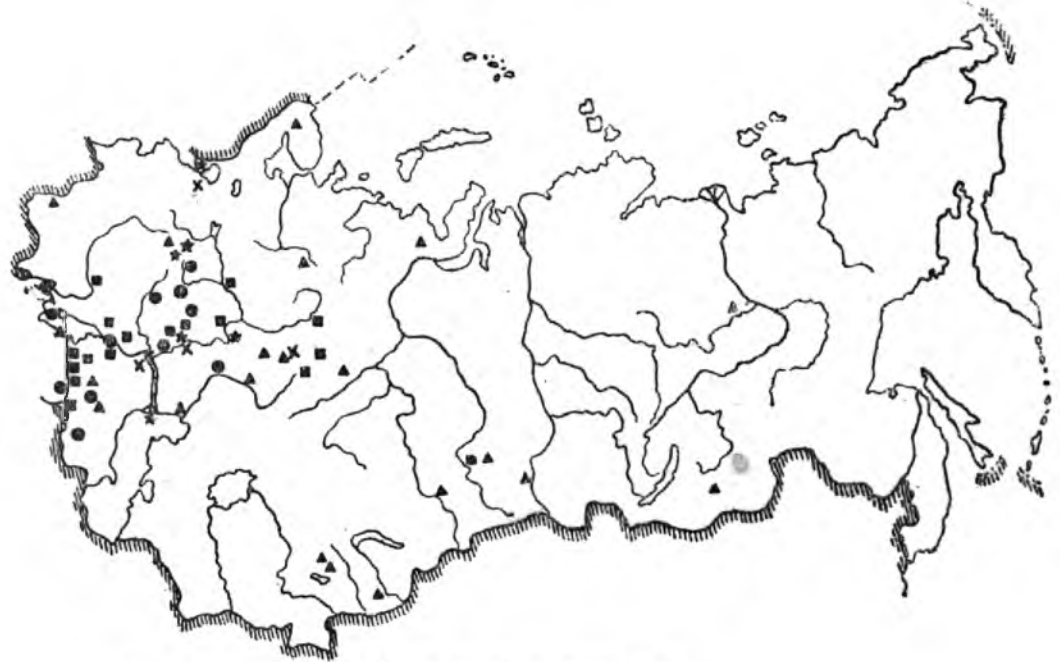
Места практики студентов:

▲ — геологов; ■ — географов; ● — биологов; × — химиков; ★ — совместные места.