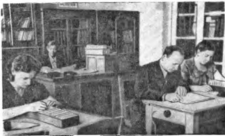
На снимке: справочный пункт отдела периодики.