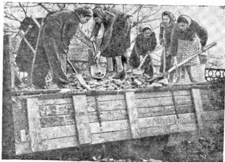
На снимке: группа студентов II курса исторического факультета на воскреснике возле V корпуса университета.