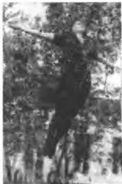
Гимнастка т. Вагенгейм.

Облит В/855 Тираж 600 Типография Сароламепрома