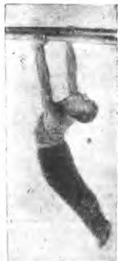
Гимнаст т. Кузнецов.