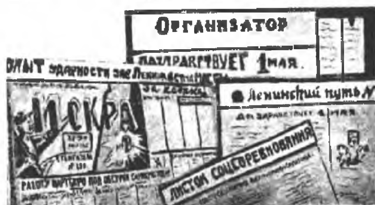
Стенгазеты: „Рационализация“—(ФПХ), „Искра“—(Медфак), „За ленинский путь“—(Медфак).

Газета имеет и хорошие достижения. Ее заслуги в пе-