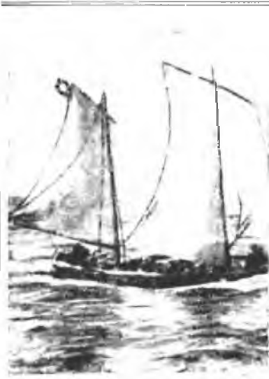
Ленинградские студенты на отдыхе в море.

— Многие студенты, не порвавшие связи с деревней, получают много писем и запросов от родных и односельчан. Газета журнала „Красное студенчество“ предлагает создать бригады из студентов-крестьян, которые вели бы эту связь организованно: ответы на письма, посылка газет, литературы, связь с сельсоветами и избачами и т. д.