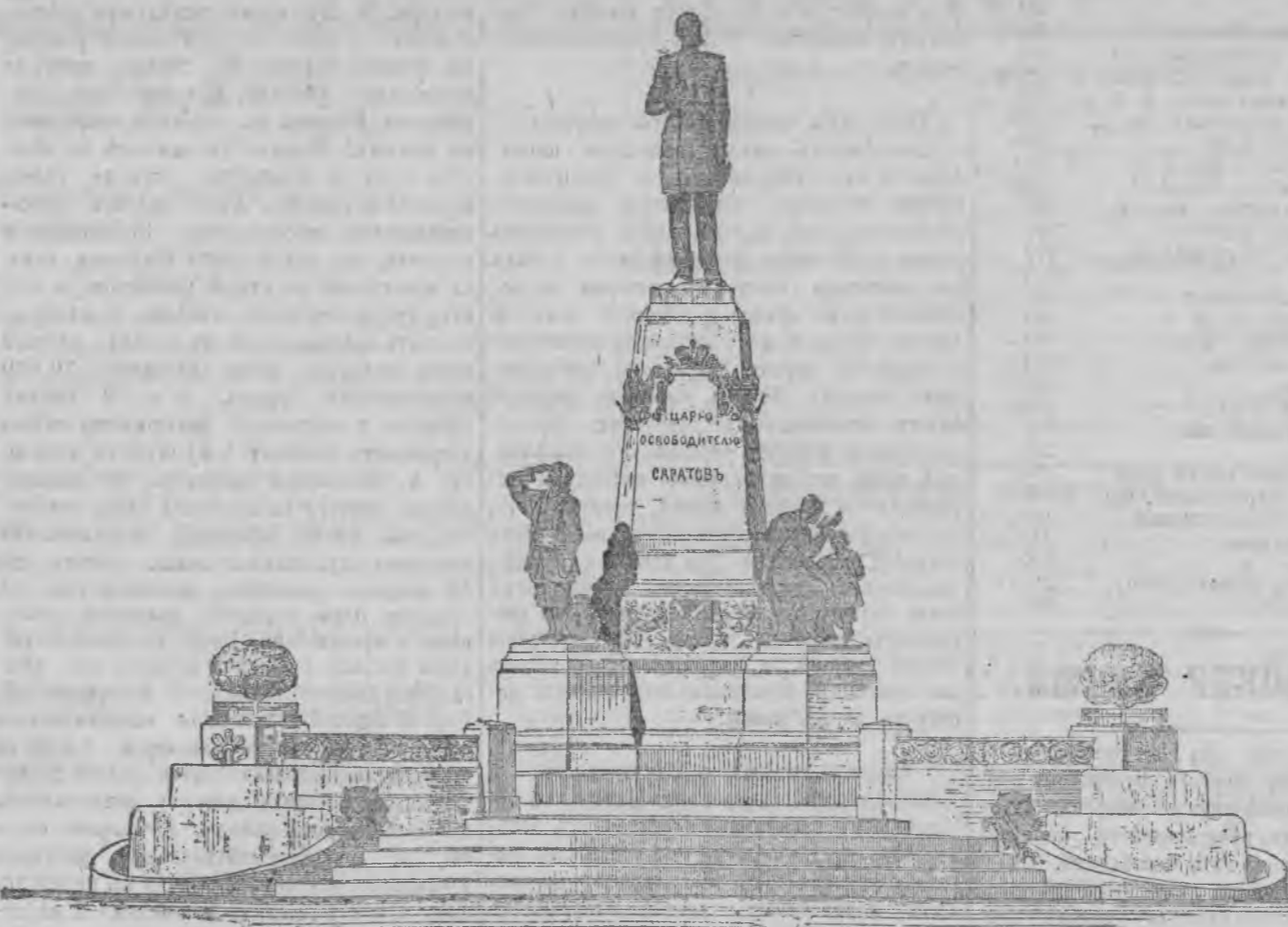
Общій видъ памятника Императору Александру II въ Саратовѣ.

БОГОНТАННОПОЛЬ. Официально сообщаютъ о двухъ чумныхъ случаяхъ въ Меккѣ. ПАРИЖЪ. Въ виду отказа Пуанкаре въ Сѣвѣ, портфель министра иностранныхъ дѣлъ предложенъ Крѣпину и имъ принять.