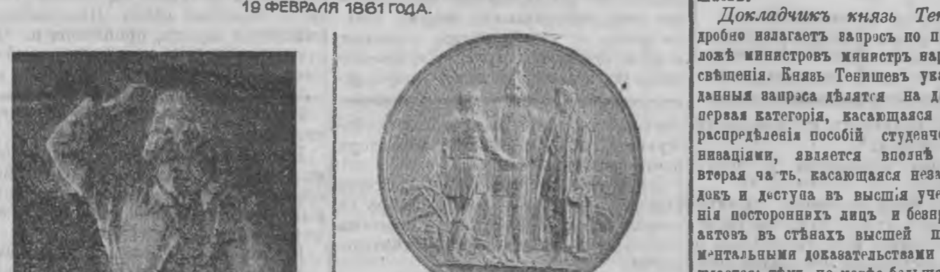
Медаль въ память 19 февраля 1861 г.

СЪ НАМИ БОЖІЕ БЛАГОСІОЗЕНІЕ НА ТВОЕЙ СВОБОДНОЙ ТРУДЪ ЗАЛОГЪ ТВОЕГО ДОМАШНЯГО БЛАГОПЛУЧІЯ И БЛАГА ОБЩЕСТВЕННАГО СЛОВА ВСЕМИЛОСТІВЬШАГО МИНИСТРА 19 ФЕВРАЛЯ 1861 ГОДА.